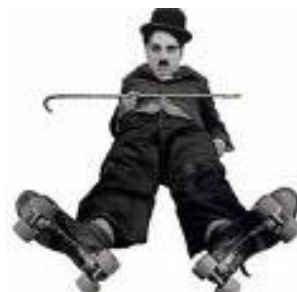
dal film CHARLOT PATTINATORE

Visione guidata di film . Si affronta il tema della Storia del Cinema dai primordi ai giorni nostri. Il programma inizia con i film dei F.lli Lumière, di Méliès e di Chaplin e continua con una serie di corti d'animazione ripercorrendo le tappe più importanti come l'avvento del sonoro, del colore e del computer. Un programma che unisce la visione del Cinema inteso come forma d'arte e cultura a quella di spettacolo popolare di intrattenimento e divertimento. Su richiesta è possibile dividere e quindi ampliare il programma in 2 incontri.