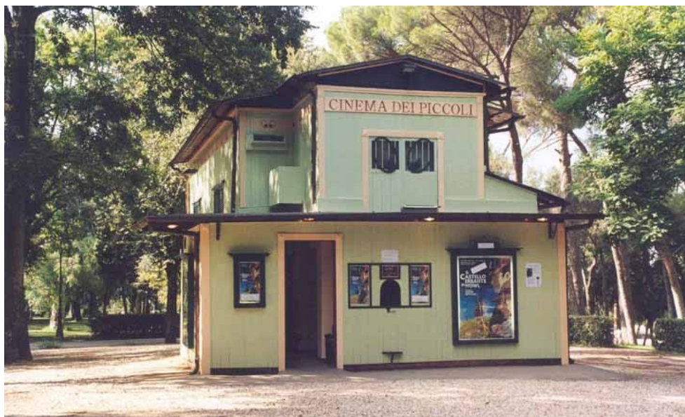
Il cinema Dei Piccoli – Roma – Parco di Villa Borghese

Ricordiamo che è attivo il sito internet www.cinemadeipiccoli.it con notizie sugli itinerari didattici, sulla storia del Cinema Dei Piccoli, sulla sala e sulle attività in corso e che è possibile contattarci all'indirizzo di posta elettronica info@cinemadeipiccoli.it .