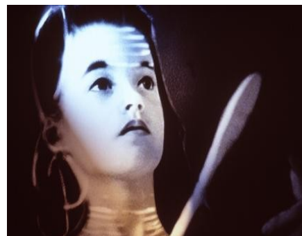
dal film "Une artiste"

Al cinema: Diritti quali il diritto all'ascolto, al rispetto, al riconoscimento della propria lingua religione cultura, all'espressione artistica, a non essere coinvolti in azioni di guerra sono affrontati attraverso una scelta di capolavori del cinema d'animazione, opportunamente introdotti per una durata complessiva di circa un'ora.