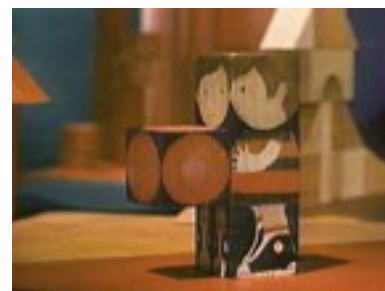
dal film Tchou tchou di Co Hoedeman

Al Cinema: Tre cortometraggi d'animazione realizzati con plastilina, pupazzi, cubi di legno. Al Museo: Visita guidata ad una serie di opere conservate nella Galleria Nazionale d'Arte Moderna