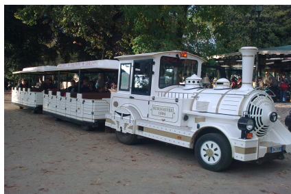
il trenino di Villa borghese

A completamento dell'itinerario un viaggio con il caratteristico trenino attraverso i viali di Villa Borghese.