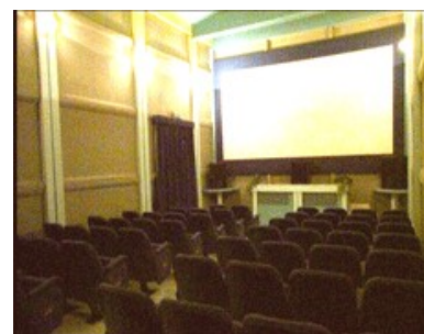
la sala del cinema Dei Piccoli

Il Cinema proposto come luogo di cultura come il Museo, il Teatro, il Parco. In una sala cinematografica "su misura". I bambini saranno guidati ad effettuare da soli i rituali dell' andare al cinema : fare la fila alla cassa, acquistare il biglietto, prendere posto in sala. Il programma consta di una serie di film scelti per i piccolissimi.