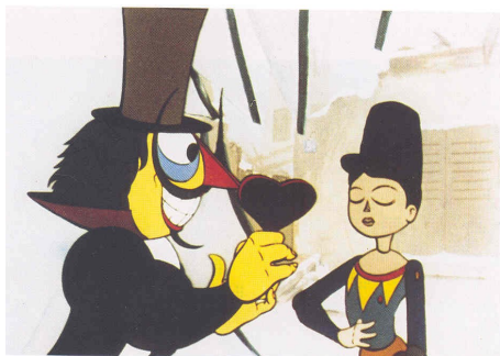
dal film "Le petit soldat" di Paul Grimault (Francia 1947)