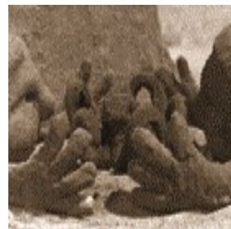
dal film Sand Castle (Il castello di sabbia) di Co Hoedeman

Al Museo i bambini seguono un percorso all'interno delle sale sui temi del museo e della creazione artistica, percorso diverso secondo l'età dei bambini. Durante la visita i bambini sono guidati da esperti in didattica museale ad una lettura attiva di alcune opere d'arte pittoriche e scultoree e alla conoscenza del linguaggio figurativo e astratto.